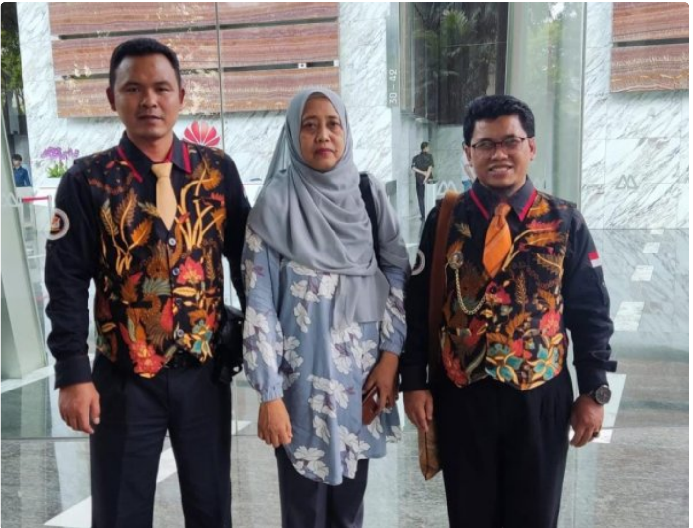
Foto: Tim LIDIK KRIMSUS RI melaporkan dugaan penyimpangan ini ke Komisi Pemberantasan Korupsi (KPK) dan Otoritas Jasa Keuangan (OJK), menuding adanya praktik kotor yang dilakukan oknum PT. Bank Negara Indonesia (Persero) Tbk di Kota Semarang. Senin (04/11/2024).

JAKARTA- Tim Divisi Hukum Lembaga Informasi Data Investigasi Korupsi dan