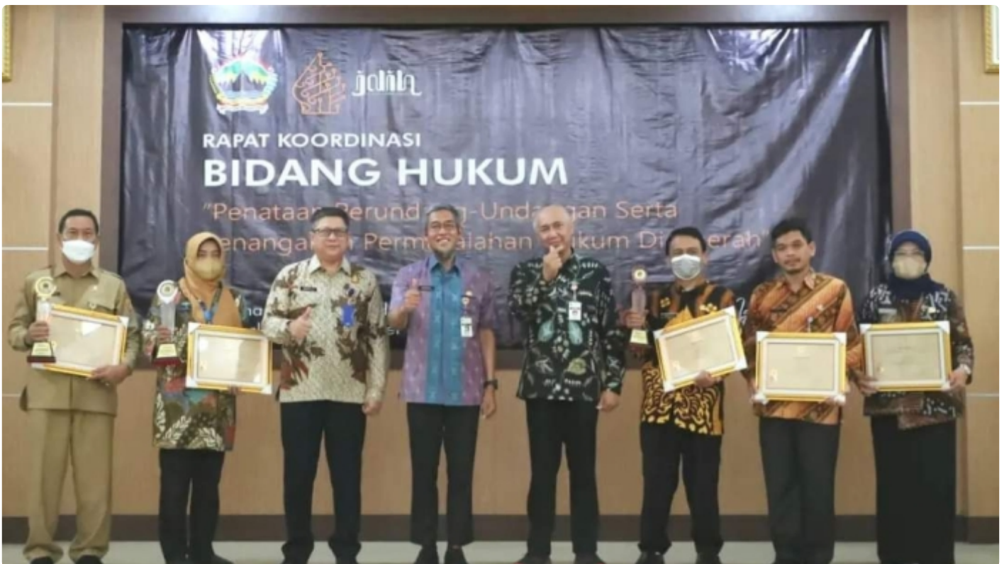
Kemenkumham Jateng Ikuti Rapat Koordinasi Bidang Hukum Provinsi Jawa Tengah Tahun Anggaran 2022

BOYOLALI - Guna membangun sinergitas dalam pembinaan pengelolaan Jaringan Dokumentasi dan Informasi Hukum (JDIH), Kantor Wilayah Kemenkumham Jawa Tengah mengikuti Rapat Koordinasi Bidang Hukum Provinsi Jawa Tengah Tahun Anggaran 2022 yang diselenggarakan oleh Biro Hukum Pemerintah Provinsi Jawa Tengah.